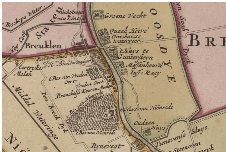
1675 (kaart Visser)

Onderstaand is een aantal oude kaarten opgenomen, waarop goed de ontwikkeling van de plek te zien is in relatie tot de aanleg van de Straatweg.