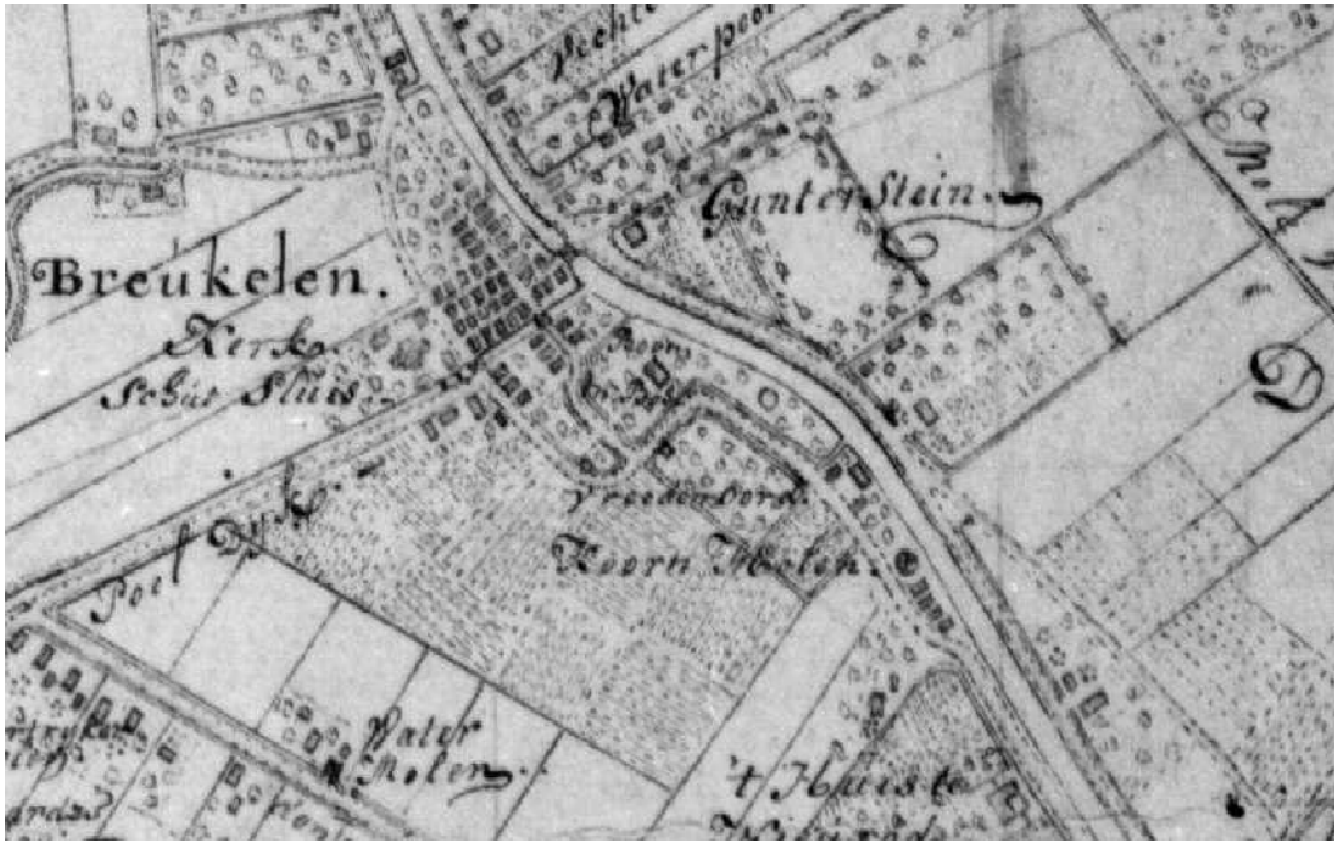
1769, Ketelaar, militaire kaart