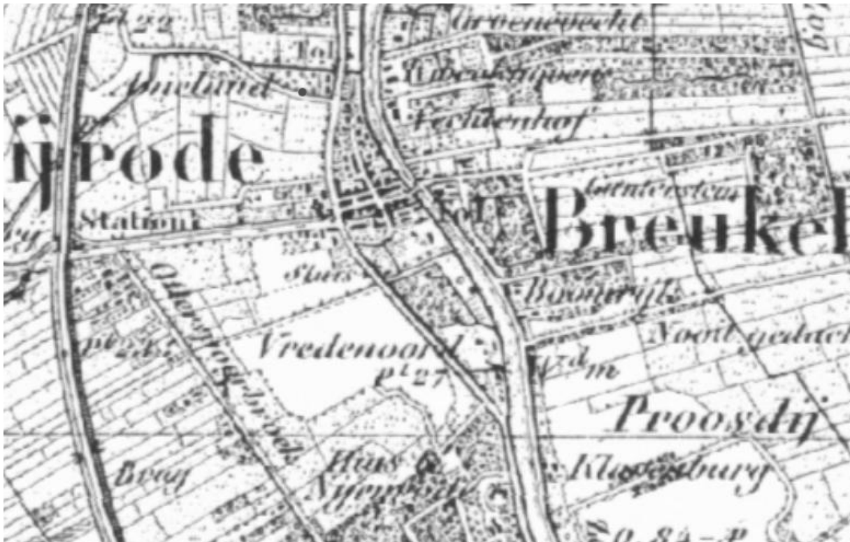
1850, topografische kaart