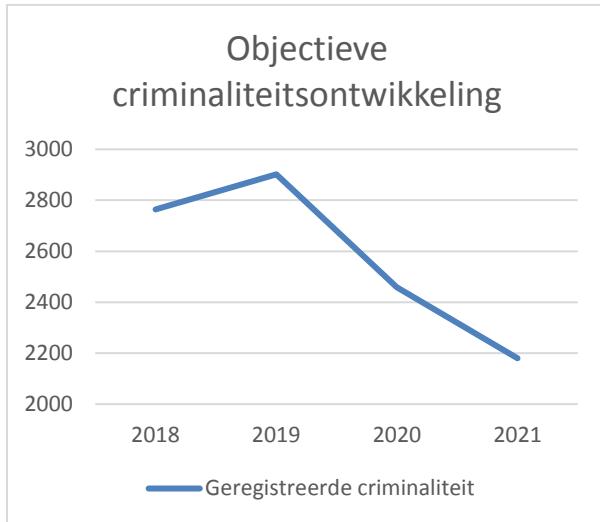
Tabel 2: De objectieve criminaliteitsontwikkeling 2018-2021

In onderstaande tabellen worden de criminaliteitscijfers weergegeven. Met de objectieve criminaliteitsontwikkeling wordt de bij politie geregistreeerde criminaliteit bedoeld, zoals woninginbraken, autokraken, diefstal of vernielingen. De subjectieve criminaliteitsontwikkeling staat voor de (on)veiligheidsgevoelens van de inwoners. Deze informatie is naar voren gekomen uit de Monitor Veiligheid en Leefbaarheid die om de drie jaar onder de inwoners wordt gehouden.