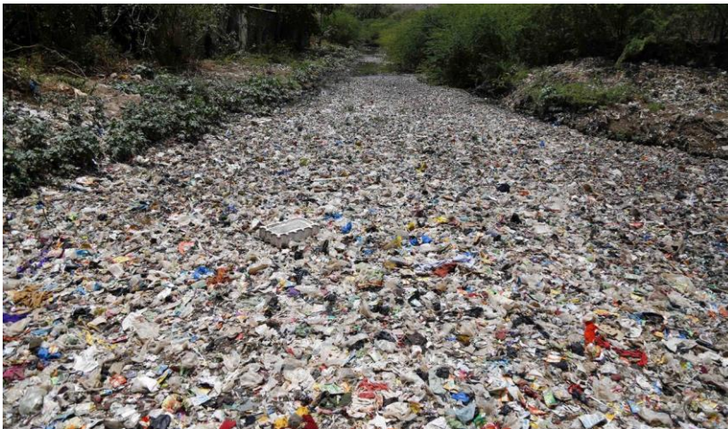
Weggegooid plastic in een rivier in India: geen vuilophaaldienst.

Duidelijk is, dat het opruimen van rotzooi op zee veel te weinig aandacht krijgt.