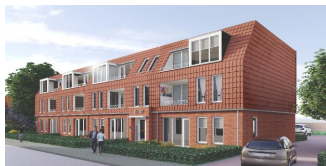
Gevelimpressie en situatietekening definitief ontwerp