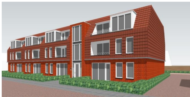
Gevelimpressie en situatietekening voorlopig ontwerp