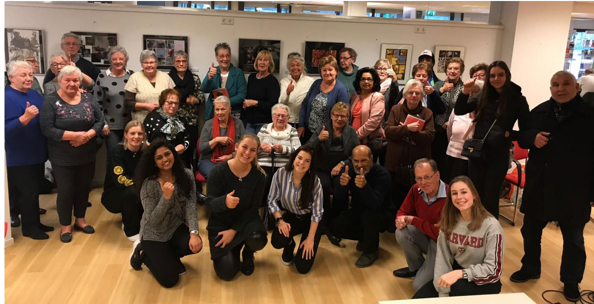
Groepsfoto eerste bijeenkomst Digibuddies

In de gemeenten De Bilt en Wijk bij Duurstede hebben we de afgelopen jaren geïnvesteerd in de Taalhuizen/Taalpunten. In Wijk bij Duurstede hebben we ingezet op contacten met werkgevers. Door hen te informeren over laaggeletterdheid onder werknemers, weten we een nieuwe groep te bereiken die profijt kan hebben van het taalaanbod.