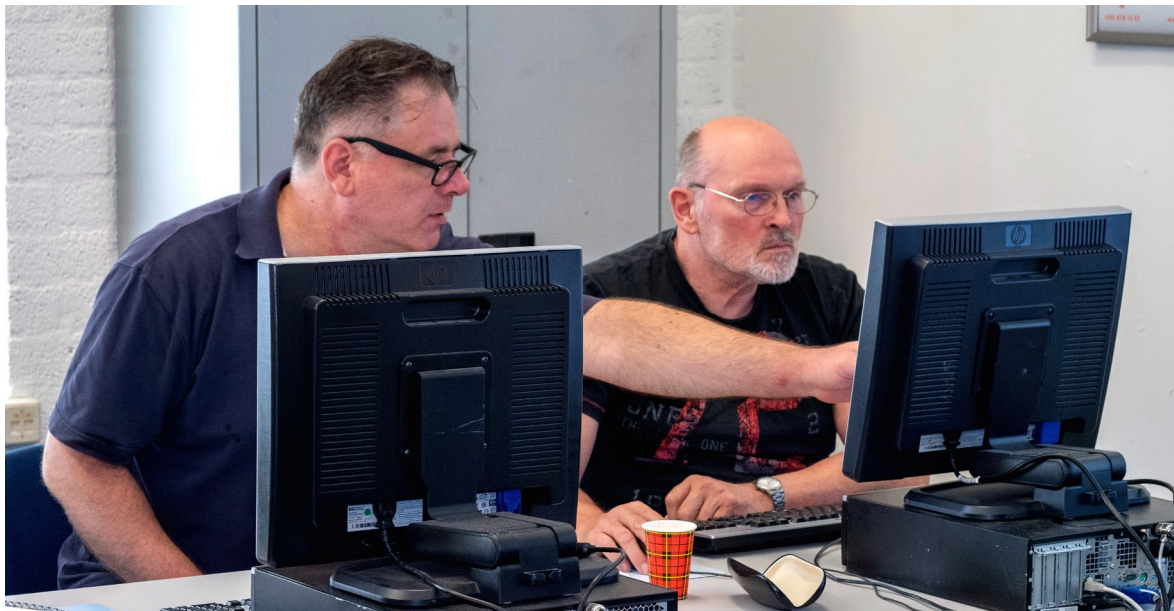
Cursus bij Digiwijs

“Het is best lastig als je hier woont, dat je dan niet kunt zeggen dat je niet kunt lezen of schrijven.”