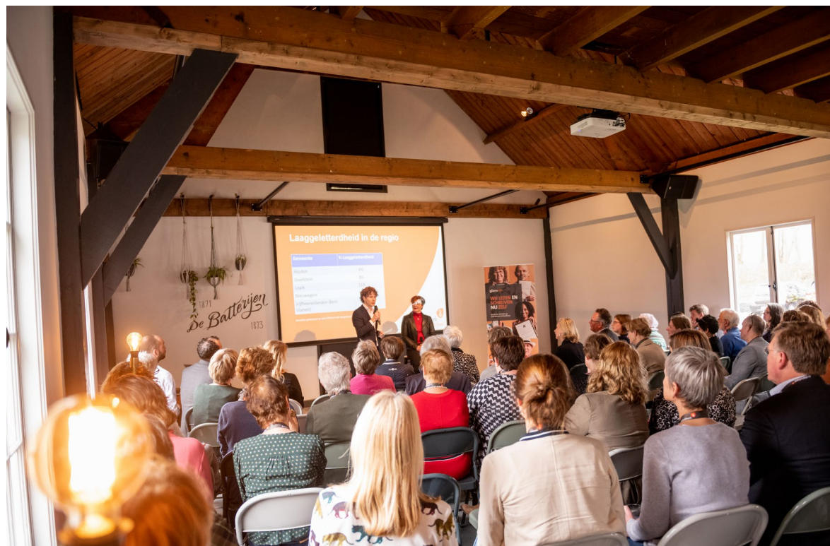
Congres Bibliotheek Lek en IJssel