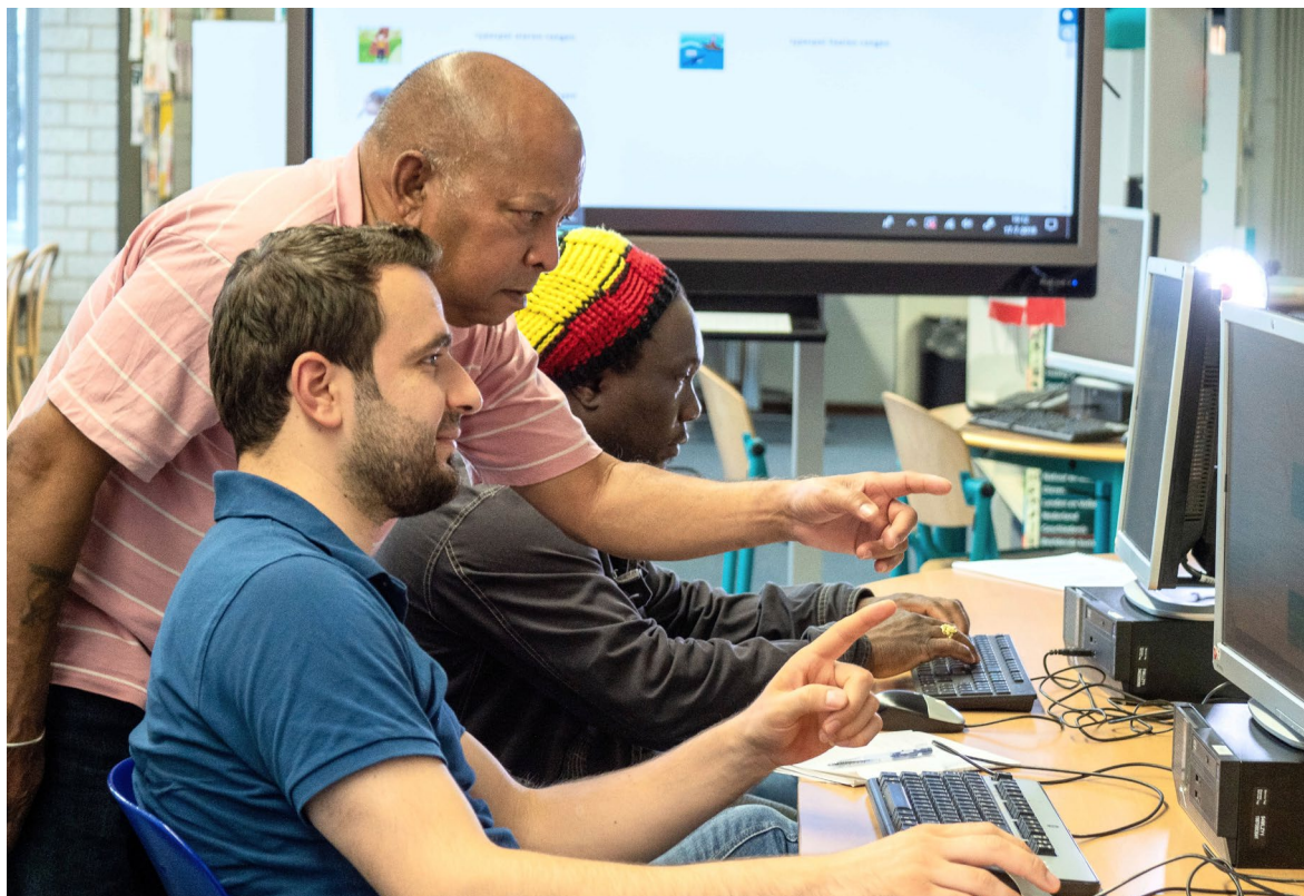
Digiwijs - uitleg bij de inloop

Taalvrijwilligers voelen zich gewaardeerd als ze kunnen deelnemen aan trainingen, bijvoorbeeld op het gebied van didactische vaardigheden of het omgaan met de diversiteit van de doelgroep. Aanbieders kunnen hierin vaker gebruik maken van elkaars kwaliteiten.