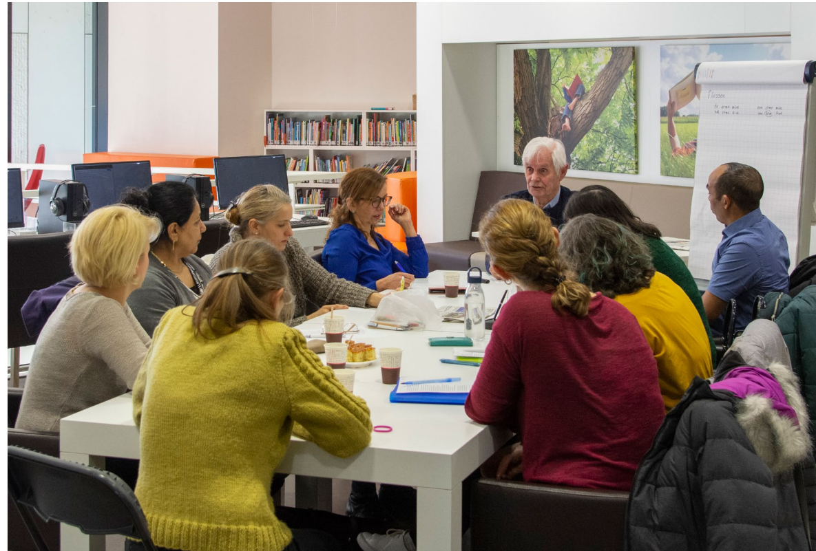
Lesgroep Stichtse Vecht

Bij de verdeling van het regionaal budget gaan we uit van budgetten per gemeente, iedere subregio heeft een 'trekkingsrecht' op het totale regionale budget. Van het jaarlijkse budget mag 25% worden meegenomen naar een volgend jaar. Jaarlijks worden de budgetten definitief vastgesteld, op basis van actuele gegevens. Daarom is niet zeker hoe de budgetten zich de komende jaren ontwikkelen.