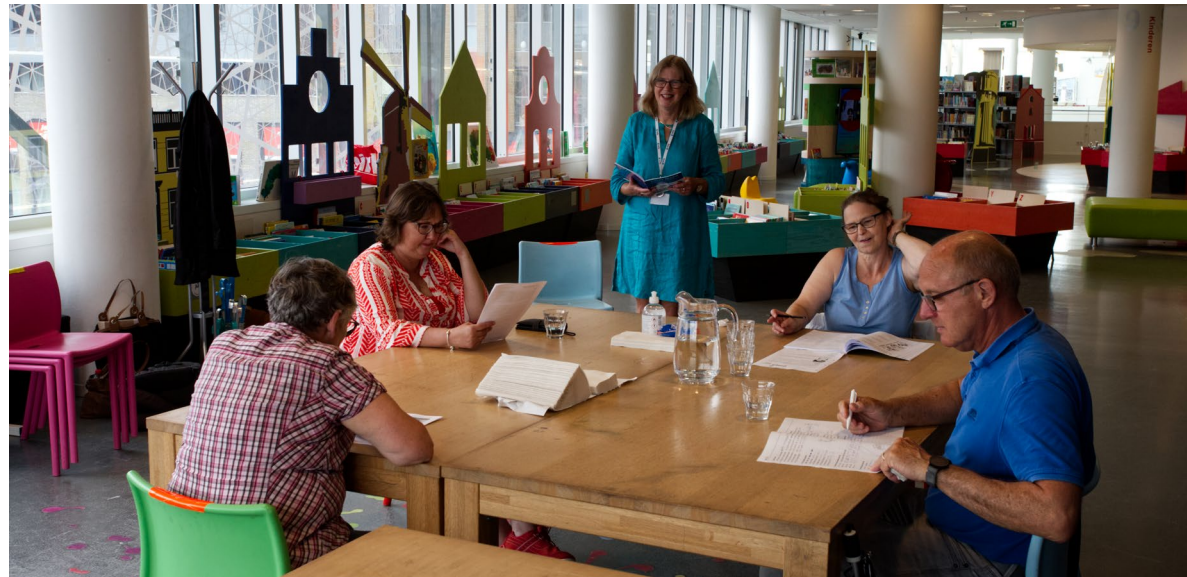
Klassikaal les bibliotheek Nieuwegein