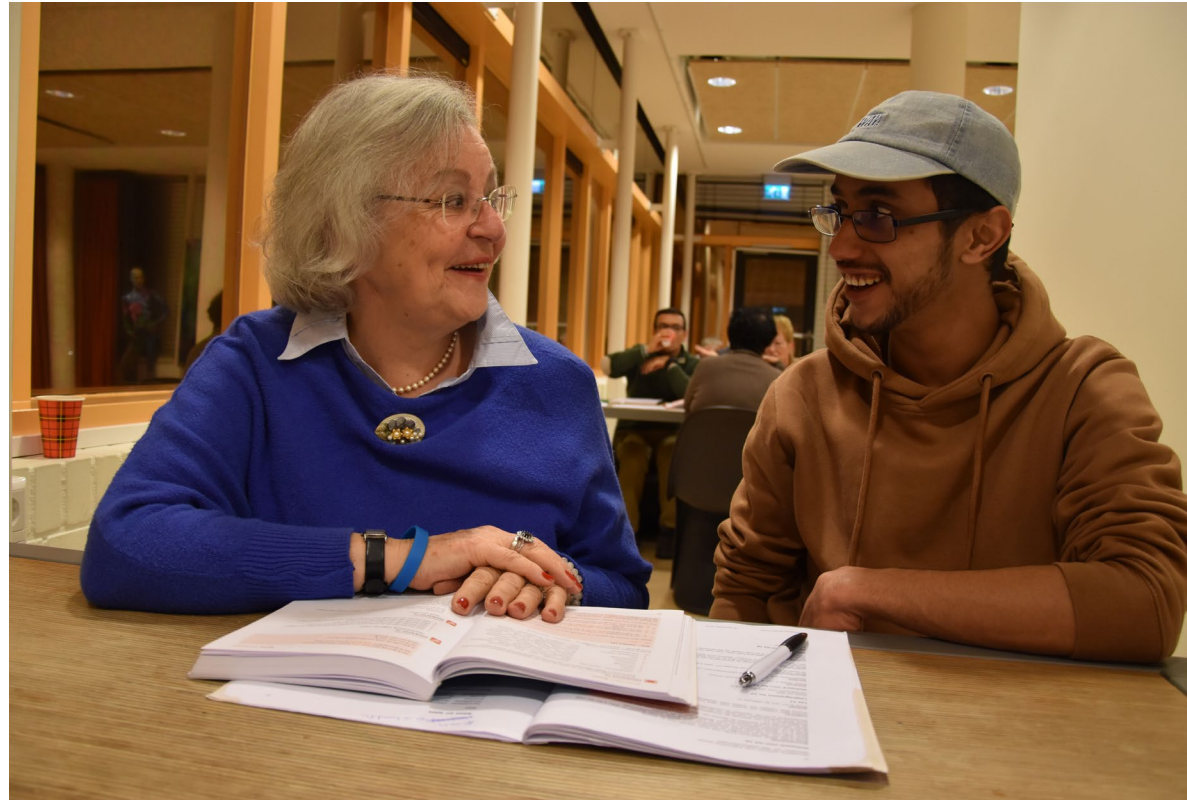
Taalmaatje in actie

We willen zoveel mogelijk aansluiten bij de mogelijkheden en motivatie van inwoners. Zij variëren in leeftijd, achtergrond, leefsituatie, leervermogen en leerdoelen. We willen het aanbod variëren, met zoveel mogelijk maatwerk. We streven daarbij naar een mix van formeel en non-formeel aanbod, met inzet van professionals en vrijwilligers, en een goede balans tussen continuïteit, vernieuwing en flexibiliteit.