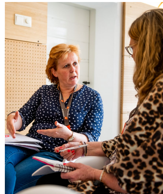
Congres Bibliotheek Lek en IJssel

Meer dan voorheen willen we in regio Utrecht Midden met en van elkaar leren. Dat gaan we doen als lerend netwerk, door helder met elkaar te communiceren over ieders aanpak en ervaringen, elkaar op te zoeken met vragen, gezamenlijk kennis op te doen rond specifieke thema's en door in pilots en projecten nieuwe werkwijzen te ontwikkelen. Ook willen we met elkaar snel kunnen inspelen op nieuwe inzichten en veranderingen in het speelveld.