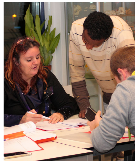
Prago-les in Overvecht

Jaarlijks stellen we de keuzes bij, op basis van resultaten, nieuwe inzichten en beschikbare middelen. We werken deze uit in een Bestedingsplan dat alle colleges van B&W in de regio Utrecht Midden vervolgens vaststellen.