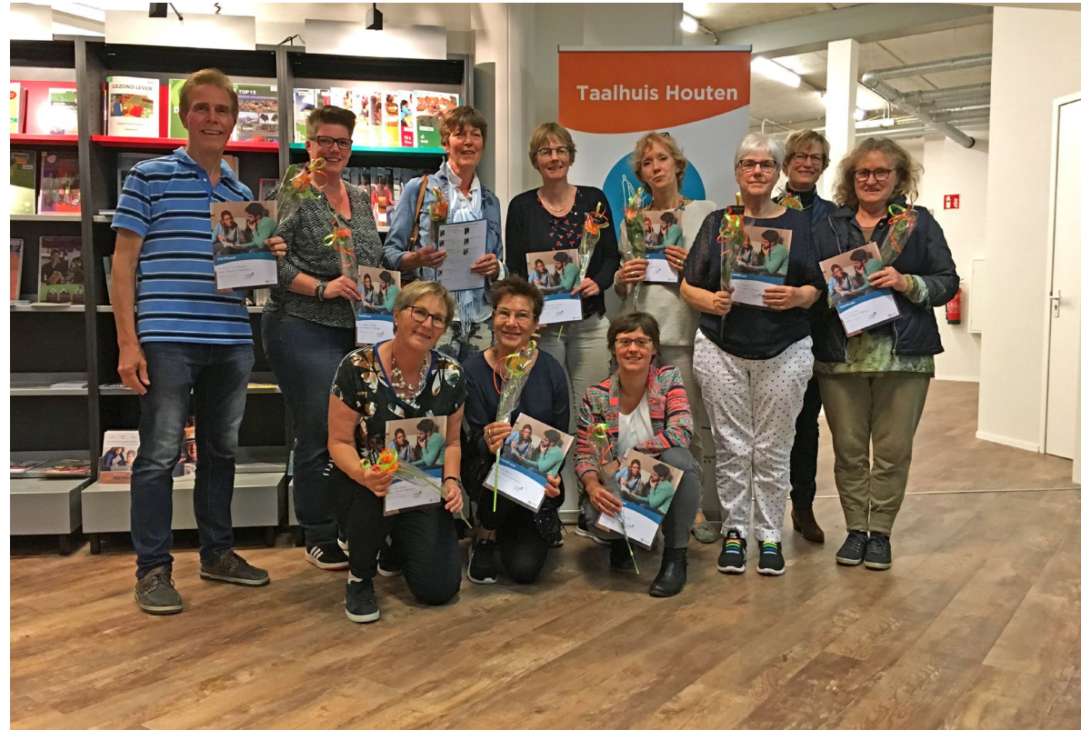
Taalhuis training Houten

De hoofdlijnen uit het meerjarenprogramma werken we uit in een jaarlijks Bestedingsplan. Daarin stellen we onze keuzes bij op basis van resultaten, nieuwe inzichten en beschikbare middelen.