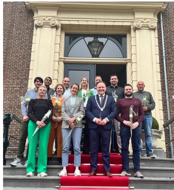
De deelnemers aan een maandelijkse ceremonie ambtseed met burgemeester Ap Reinders op het bordes van Goudestein.