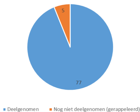
Deelname aan Training integriteit nieuwe medewerkers

Nieuwe medewerkers schrijven zich via het systeem SV Talent zelf in voor één van de trainingen. Zoals zichtbaar is in de volgende figuur heeft het grootste deel van de nieuwe medewerkers deelgenomen aan de training integriteit. Deelnemers die dit nog niet hebben gedaan hebben een oproep gekregen om zich alsnog in te schrijven.