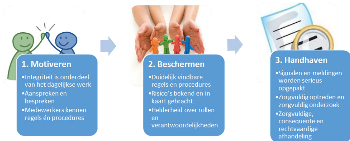
De pijlers van de integere ambtelijke organisatie

Voor de ambtelijke organisatie is integriteit een waarde die iedere medewerker dagelijks meedraagt. Dat nieuwe medewerkers de eed of belofte afleggen en een training integriteit volgen is belangrijk. Maar dit is niet voldoende voor een integere organisatie. Integriteit moet onderdeel zijn van het dagelijkse werk, vervlochten met de reguliere bezigheden. Dit wordt weergegeven in de pijlers 'motiveren, beschermen en handhaven'.