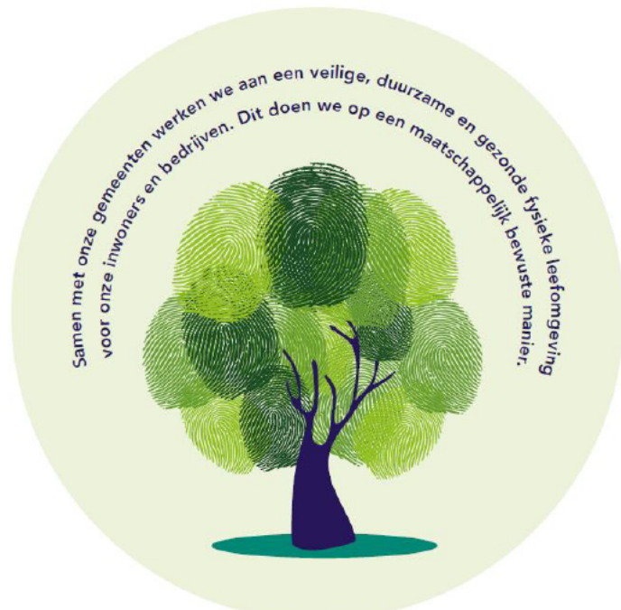
FIGUUR 1: MISSIE ODRU

Onze gemeenten kennen een diversiteit aan bedrijven. Een beperkt aantal bedrijven valt onder de Brzo-inrichtingen 5 . De Omgevingsdienst Noordzeekanaalgebied verzorgt bij deze bedrijven de vergunningverlening, toezicht en handhaving. De provincie is bevoegd gezag voor de bouw- en milieuaspecten van een bepaalde categorie bedrijven. Een deel van de bijbehorende, uitvoerende bouwtaken wordt waarschijnlijk overgebracht van de gemeenten naar de Omgevingsdiensten RUD 6 en ODRU. Grote verkeersstromen over weg en spoor zorgen voor een forse druk op de fysieke leefomgeving. De ODRU regisseert de uitvoering van projecten voor geluidssanering (c.q. gevelaanpassingen). Ook zijn we alert op ondermijning en de risico's daarvan.