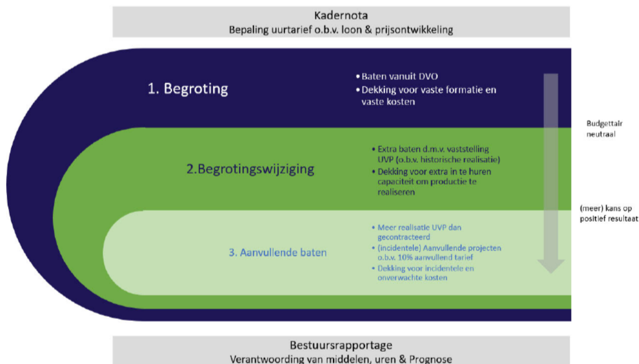
FIGUUR 2: BEGROTINGSMETHODIEK BIJ DE ODRU

Figuur 2 geeft de systematiek van begroten grafisch weer.