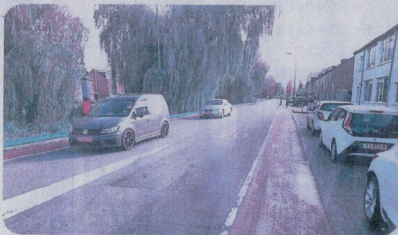
Aanpassingen op de Plesmanlaan voor een nieuwe woonwijk.

In het onderzoek zijn diverse scenario's opgenomen over hoe het verkeer uit de nieuwe wijk gaat rijden via het Zandpad richting Breukelen en via de Diependaalsdijk, Driehoekslaan en Plesmanlaan. En bij alle varianten is er eigenlijk geen groot probleem, maar de verwachting is dat 90% van de automobilisten zal kiezen voor de Plesmanlaan, ook omdat de gemeente van het Zandpad een fietsstraat wil maken om sluisverkeer langs de Vecht te weren. Bij de nieuwbouw is de kruising Suyderhoflaan -Diependaalsdijk de enige in- en uitgang van de wijk en dat kan volgens het onderzoek. Wel moet er nog een extra toegang komen voor hulpdiensten. 'Een tweede