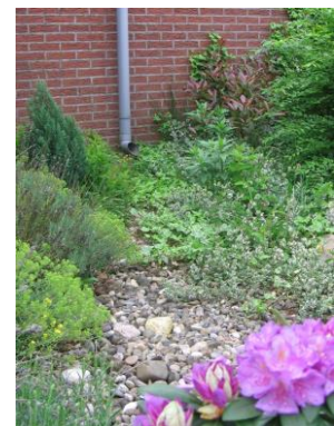
afgekoppelde regenpijp