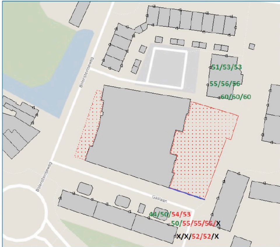
Figuur 2 Toetsing geluidbelasting L_{A,T} vanwege ontwerp Cita op bestaande woningen