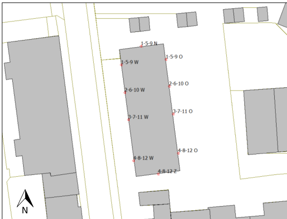
Figuur 2: Ontvangerpunten