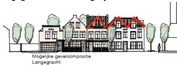
Afbeelding 2: Andere kapvorm voor maximale zonstraling Langegracht.

de vorm van het dak zodanig gekozen wordt, dat de zonstraling naar de Langegracht zo min mogelijk belemmerd wordt (zie afbeelding 2).