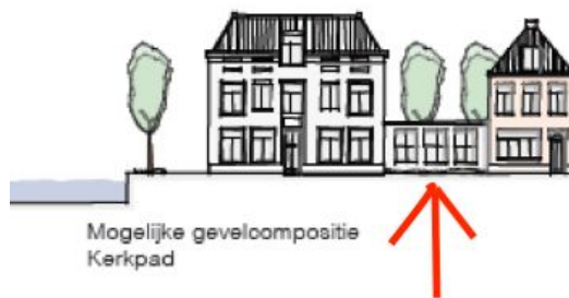
Afbeelding 4: Geen garantie dat pand laag blijft.