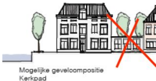
Afbeelding 1: te vervallen deel a.g.v. insteekhaven.

Dit zou bijvoorbeeld kunnen door voor de woningen aan de Vecht een insteekhaventje voor sloepen op te nemen of door bijvoorbeeld de lage woning te laten vervallen (zie afbeelding 1) en de grote hoekwoning verder van de Vecht af (op de plek van de kleine woning) te plaatsen.