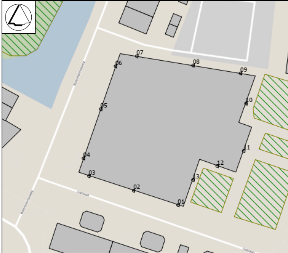
Figuur 2: Ontvangerpunten