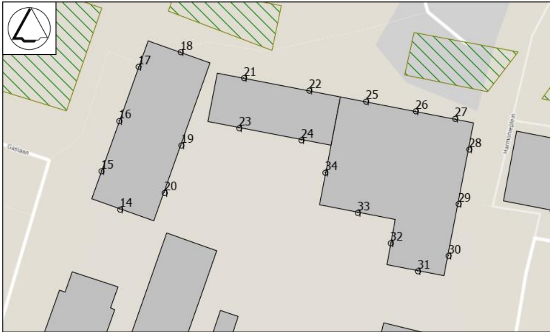
Figuur 3: Ontvangerpunten Zuidelijk bouwblok