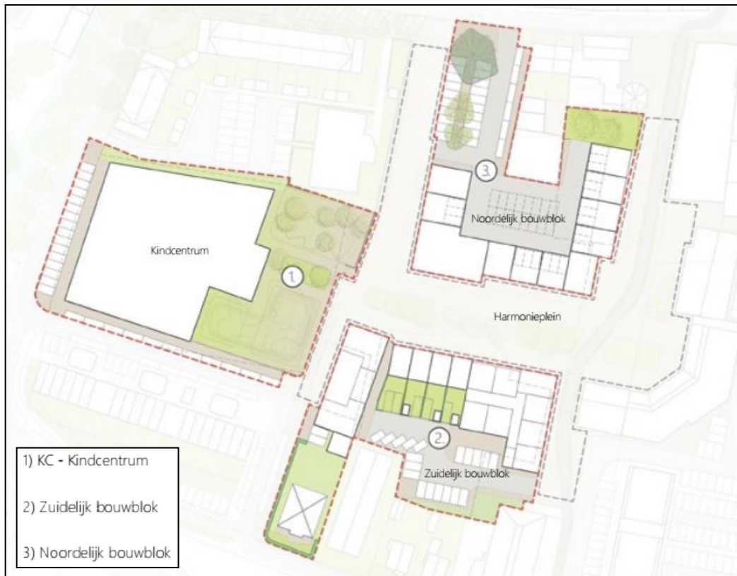
Figuur 1: Deelgebieden Harmonieplein Maarsse-dorp