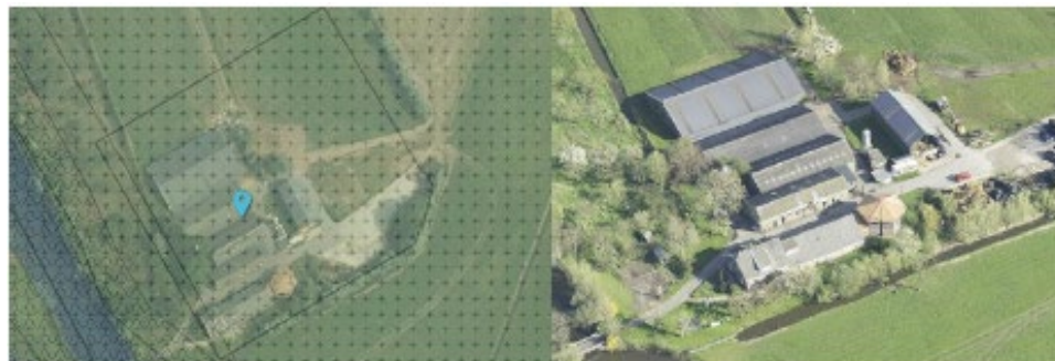
Bestemmingsplan met bouwvlak (links) en luchtfoto bestaande situatie (rechts)

Het perceel Breukelerwaard 2 in Breukelen, gelegen aan de westzijde van de A2 in de nabijheid van Nieuwer ter Aa, maakt onderdeel uit van het geldende bestemmingsplan Landelijk gebied West. Op de onderstaande afbeelding ziet u een weergave van het bestemmingsplan zoals opgenomen op ruimtelijkeplannen.nl (de luchtfoto in de ondergrond).