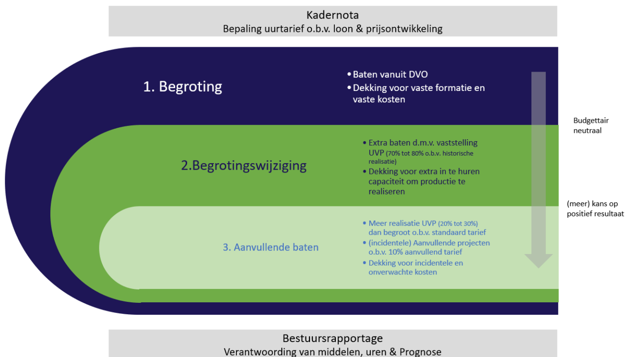
FIGUUR 2: BEGROTINGSMETHODIEK BIJ DE ODRU

Figuur 2 geeft de systematiek van begroten grafisch weer.