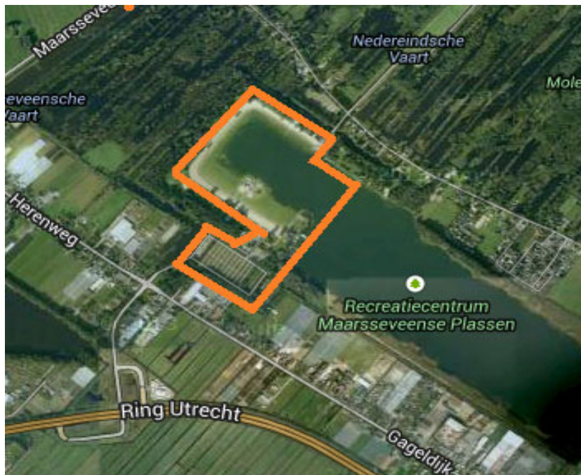
Figuur 1 Begrenzing van het evenemententerrein bij de grote plas van de Maarsseveense Plassen, zoals opgenomen wordt in het bestemmingsplan.