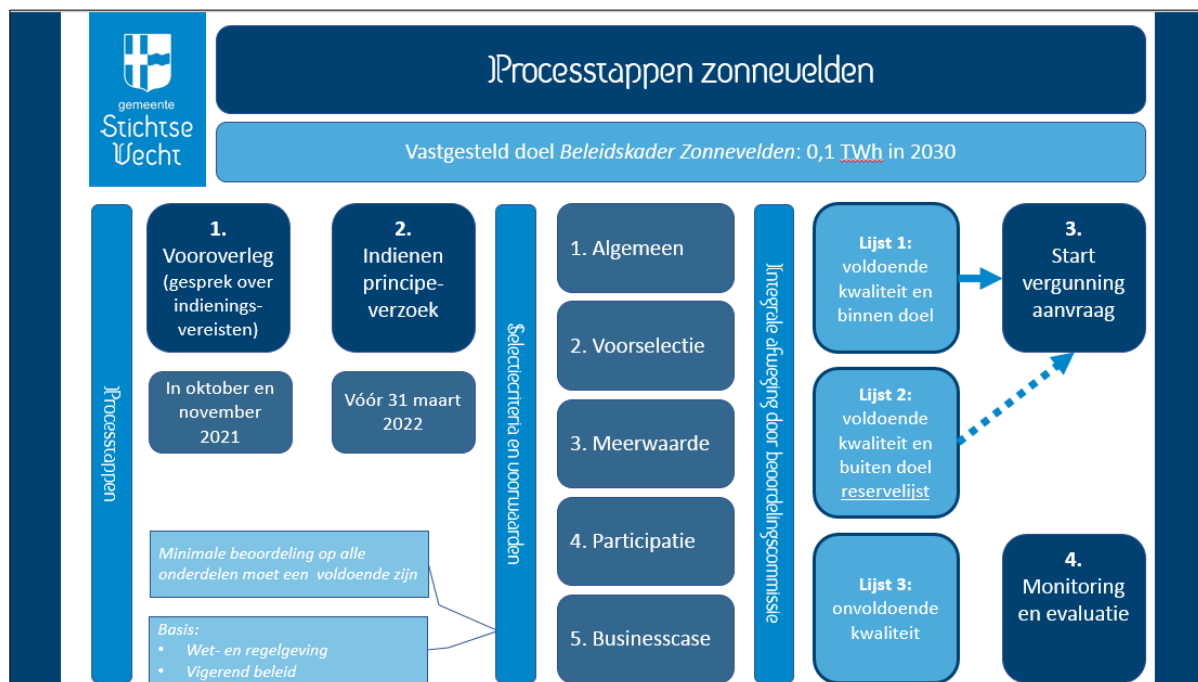
Figuur 1 processtappen zonnevelden