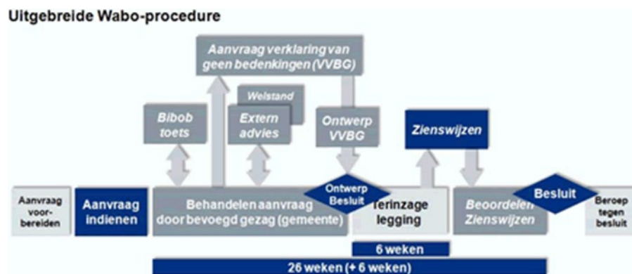
Figuur 3 Proces uitgebreide Wabo-procedure

De volgende stap is de vergunningsaanvraag. Het realiseren van een zonneveld past vaak niet binnen het geldende bestemmingsplan. Om medewerking te kunnen verlenen aan een zonneveld zal het bestemmingsplan gewijzigd moeten worden. Het is ook mogelijk om van het geldende bestemmingsplan af te wijken met behulp van de “uitgebreide WABO procedure”. Na de inwerkingtreding van de Omgevingswet worden alle bestemmingsplannen automatisch onderdeel van het (tijdelijke) Omgevingsplan. Om medewerking te verlenen aan een zonneveld moet in dat geval het Omgevingsplan worden gewijzigd. Maar ook binnen de nieuwe wet is het mogelijk om van het Omgevingsplan af te wijken. Dat kan door middel van een buitenplanse omgevingsplanactiviteit, ook wel de “buitenplanse OPA” genoemd.