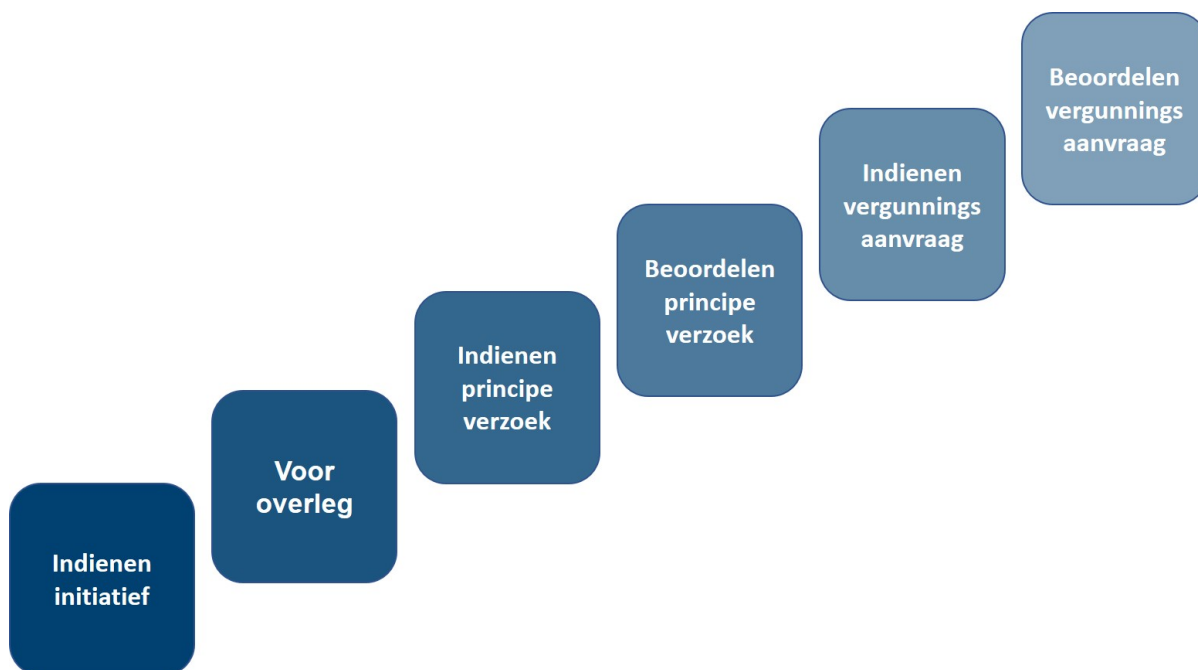
Figuur 4 processtappen zonnevelden