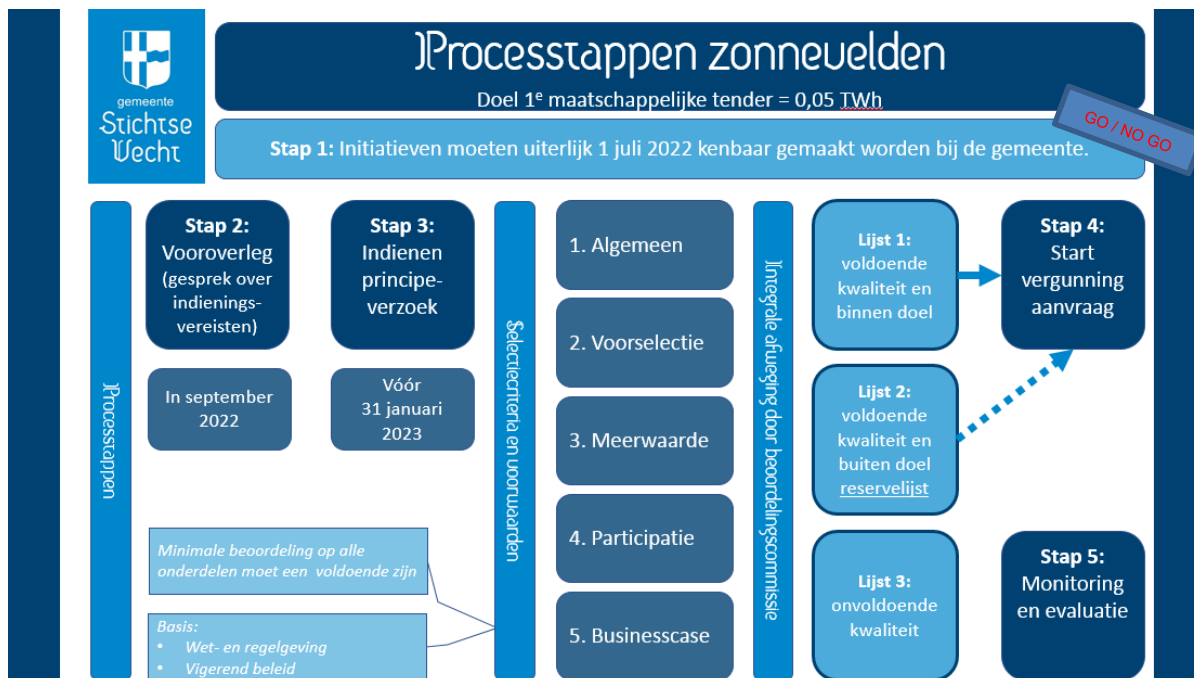
Figuur 1 Processtappen zonnevelden