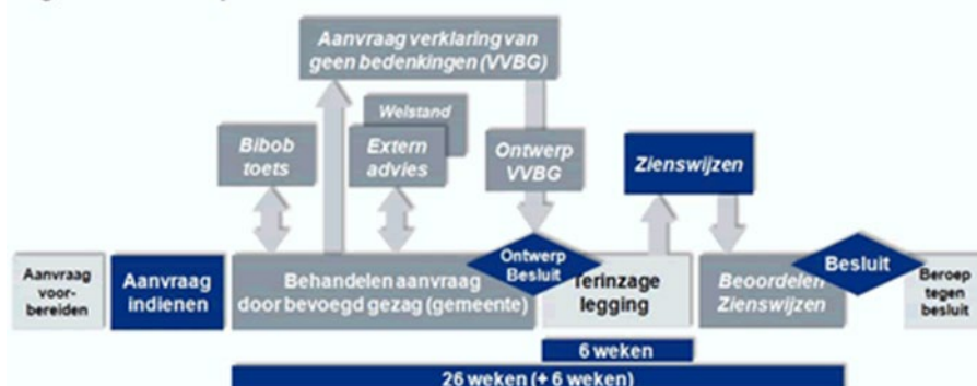
Figuur 3 Proces uitgebreide Wabo-procedure