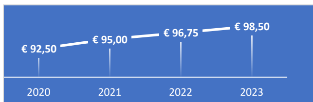
FIGUUR 1: ONTWIKKELING UURTARIEF

In figuur 4 is de tariefontwikkeling van de afgelopen vier jaar opgenomen. Rekening houdend met de nacalculatie voor 2021 1 en voorlopige nacalculatie voor 2022 van respectievelijk +0,95% en +2,04% volgens de systematiek in de kadernota (zie tabel 2) stijgt het tarief voor 2023 daardoor met 1,87%. Het tarief komt daarmee uit op: € 98,50. Voor uren boven de in de contracten vastgelegde uren (veelal aanvullende opdrachten) geldt een opslag van 10%.