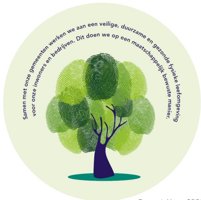
FIGUUR 1: MISSIE ODRU

Dat doen we met een breed aanbod van producten en diensten op het gebied van bodem, milieu-, bouw- en woningtoezicht, vergunningen en meldingen, geluid en lucht, natuur- en milieueducatie, ruimtelijke ordening, klimaat, energie en duurzaamheid.