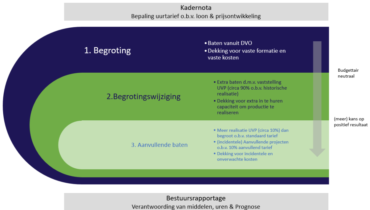
FIGUUR 2: BEGROTINGSMETHODIEK BIJ DE ODRU

Figuur 2 geeft de systematiek van begroten grafisch weer.