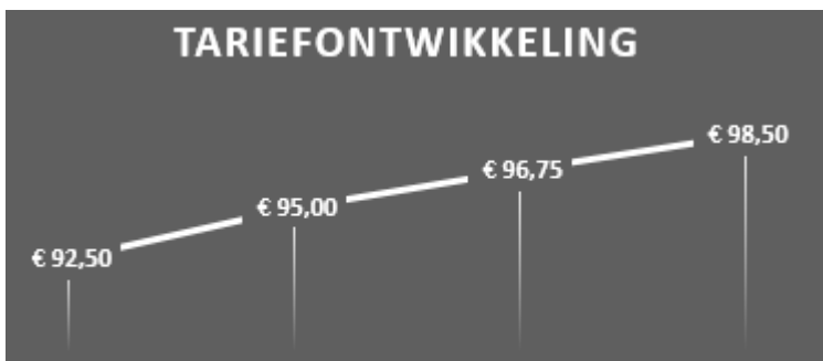
FIGUUR 3: TARIEFONTWIKKELING 2020 - 2023

In de volgende grafiek (figuur 3) is de tariefontwikkeling opgenomen van de afgelopen vier jaar. Hierin is af te lezen dat afgelopen vier jaar het tarief steeds matiger is gegroeid. In het eerste jaar was er een stijging van vanwege de loon- en prijsontwikkelingen € 2,50 per uur en dit jaar wordt er, net als vorig jaar, een stijging voorgesteld van € 1,75 per uur.