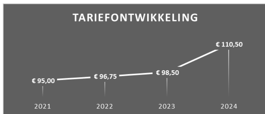
FIGUUR 3: TARIEFONTWIKKELING 2021 - 2024

Onderstaande figuur geeft weer wat de tariefontwikkeling is ten opzichte van de afgelopen jaren: