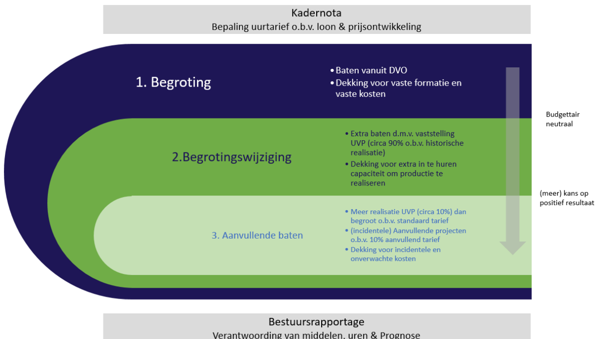
FIGUUR 2: BEGROTINGSMETHODIEK BIJ DE ODRU

Figuur 2 geeft de systematiek van begroten grafisch weer.