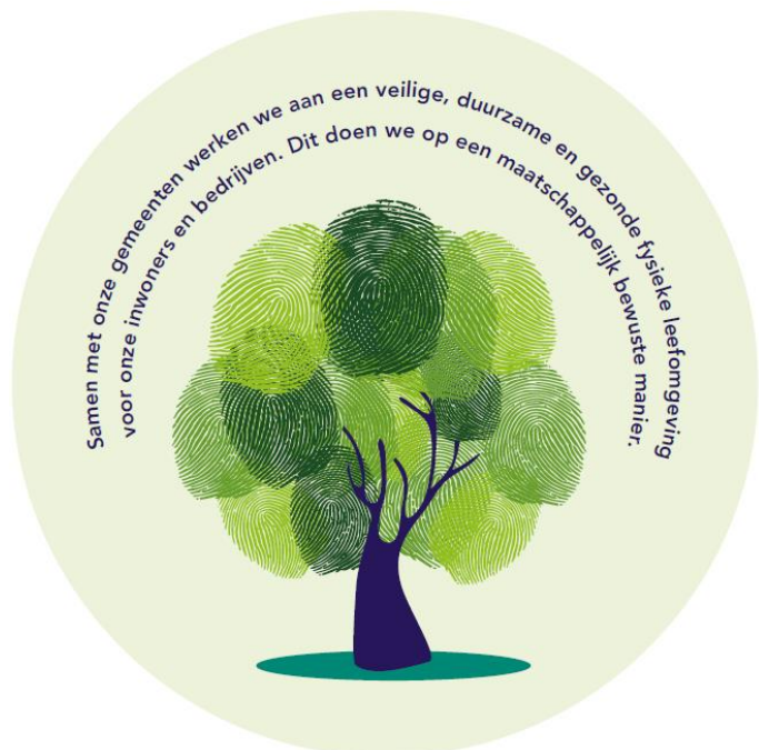
FIGUUR 1: MISSIE ODRU

Ruim 200 vakspecialisten, variërend in leeftijd en achtergrond, ondersteunen gemeenten en andere samenwerkingsorganisaties zoals de RUD, de veiligheidsregio, het waterschap en de GGD bij de uitvoering van hun milieu- en omgevingstaken.