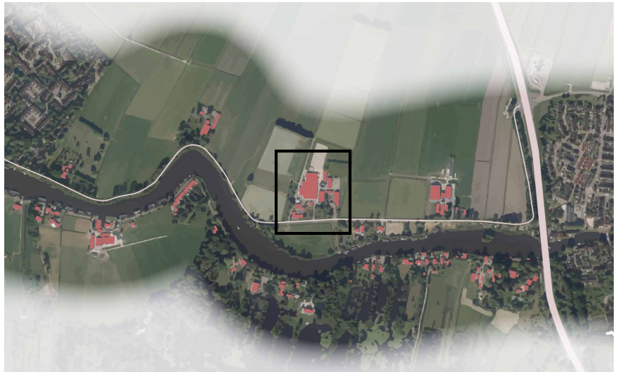
voorbeeld van gebiedseigen tinten

Het plangebied is gelegen aan een landelijke weg die Vreeland en Loenen aan de Vecht met elkaar verbindt. Aan deze weg liggen enkele erven in een open landschap. Op deze van oudsher agrarische erven staat bebouwing haaks of parallel aan de weg.