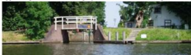
Afb. 04 (brug bij de Weersluis)

Voor de vorm en materialisatie van de brug heeft, om aan te sluiten bij de al aanwezige bruggen langs de Vecht, de brug bij Weersluis als referentie gediend.