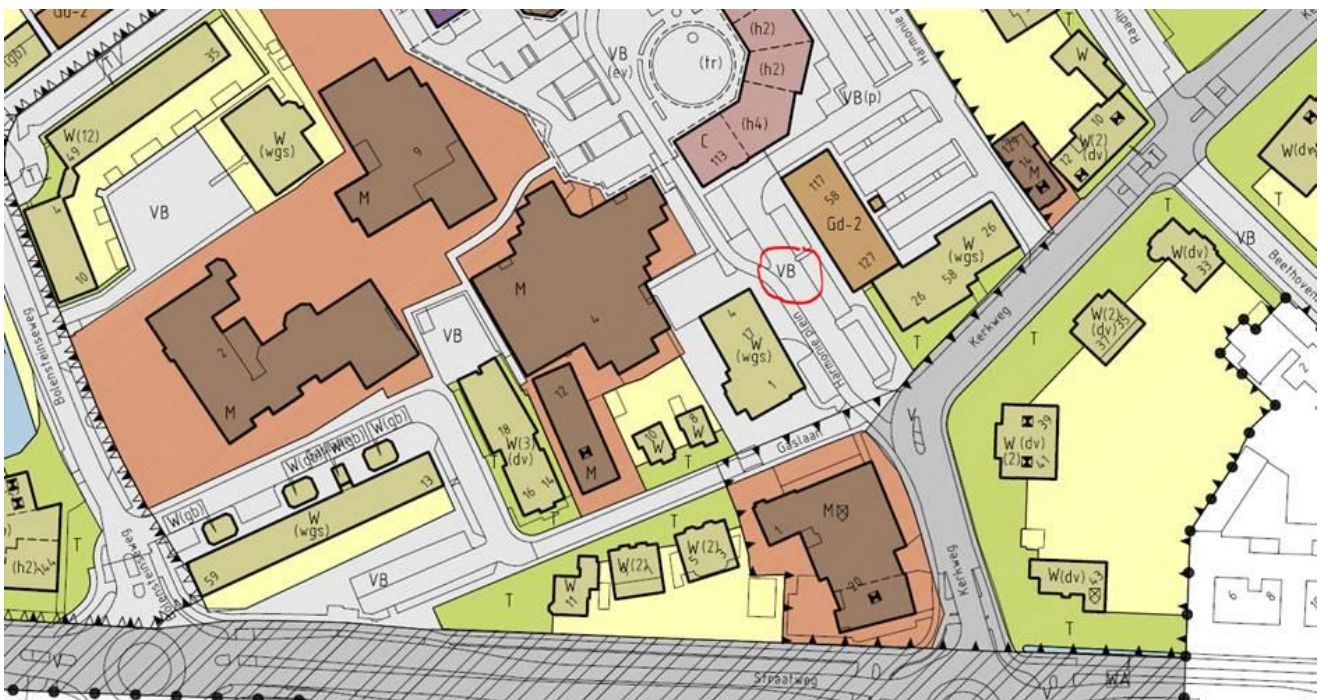
Uitsnede uit geldend bestemmingsplan Maarsse aan de Vecht

De Gaslaan is al meer dan 100 jaar een weg en heeft in het geldende bestemmingsplan/Omgevingsplan Maarsse aan de Vecht een verkeersbestemming, namelijk "Verkeer, verblijfsgebied". Deze bestemming geldt voor het gehele centrumgebied van Maarsse-dorp. Ook binnen het GVVP hebben alle wegen in het centrum van Maarsse-dorp (m.u.v. Straatweg en Plesmanlaan) de aanduiding "erftoegangsweg". Het opheffen van de knip heeft geen gevolgen voor de bestemming. Er is hier immers geen sprake van een bestemming die alleen een doodlopende weg toestaat. De ruimtelijke veranderingen die ontstaan door het bestemmingsplan Kindcentrum, zuidblok en noordblok veranderen de bestemming van het wegvak van de Gaslaan niet. Er is dan ook geen sprake van planschade op grond van het bestemmingsplan. Of er sprake is van nadeelcompensatie door het nemen van een verkeersbesluit zal t.z.t. moeten blijken, maar is voorsnog niet waarschijnlijk. De geldende bestemming van de Gaslaan geeft namelijk de mogelijkheid om hier een doorgaande weg te maken hetgeen voor 1997 feitelijk zo was. De bestemming is al vele jaren geldend. Een verkeersbesluit om een weg doodlopend te maken hoeft niet per definitie een besluit voor altijd te zijn. Er kunnen situaties voordoen die ertoe noodzaken om een eerder genomen verkeersbesluit alsnog te wijzigen. Hiervoor zal wel een apart verkeersbesluit genomen moeten worden waar bezwaar op mogelijk is.