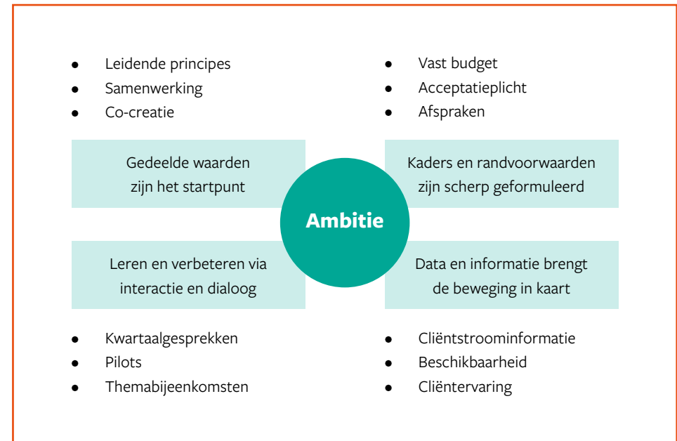
FIGUUR 2: HET UTRECHTSE MODEL

We doen dit als 16 gemeenten samen en betrekken cliënten, toegangspartijen en aanbieders hierbij. Ook zoeken we verbinding met andere partners, zoals woningcorporaties