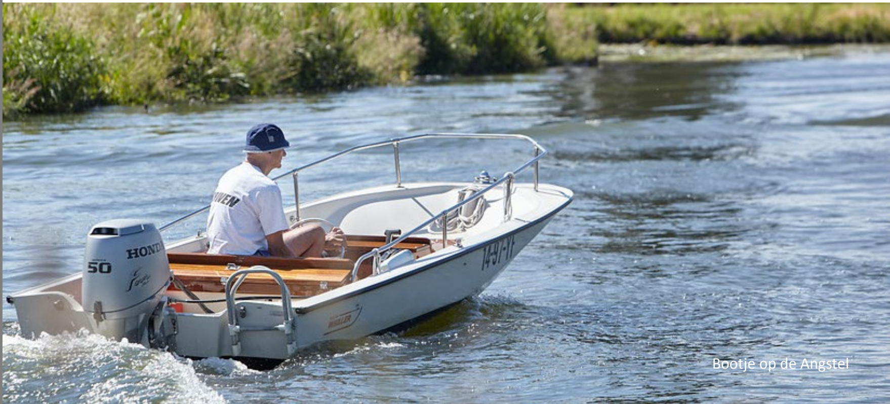
Bootje op de Angstel

Met elkaar aangeven wat we belangrijk vinden in onze leefomgeving.