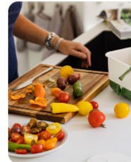
Gft & etensresten