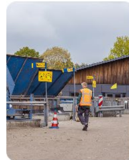
Milleustraat van de toekomst