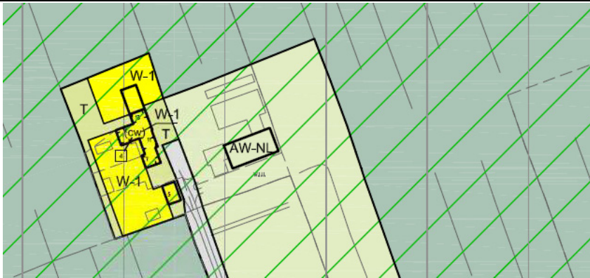
Voorstel nieuwe bestemmingsplan