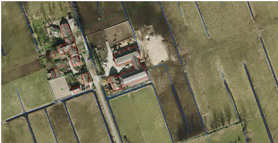
Luchtfoto bestaande situatie

Op 12 september 2012 is er op verzoek van de heer Van der Schaft een overleg geweest tussen de gemeente en het waterschap over de bestemming van het perceel aan de Nimmerdoornlaan 10. Tijdens dit overleg bleek dat de bestemming van het betreffende perceel in het nieuwe bestemmingsplan Landelijk Gebied Maarssen sterk afwijkt van de bestemming uit het geldende bestemmingsplan. Het bouwvlak is veel kleiner bestemd dan in het geldende bestemmingsplan waardoor de aanwezige bedrijfsschuren buiten het bouwvlak komen te liggen. Gezien de bestaande rechten en de aanwezige bebouwing dient dit bij de vaststelling hersteld te worden. Het bouwvlak in het nieuwe bestemmingsplan moet overeenkomen met het bouwvlak uit het geldende bestemmingsplan. Omdat de eigenaar van het perceel nooit eerder gebruik heeft gemaakt van zijn recht om in te spreken is deze omissie helaas nu pas aan het licht gekomen.