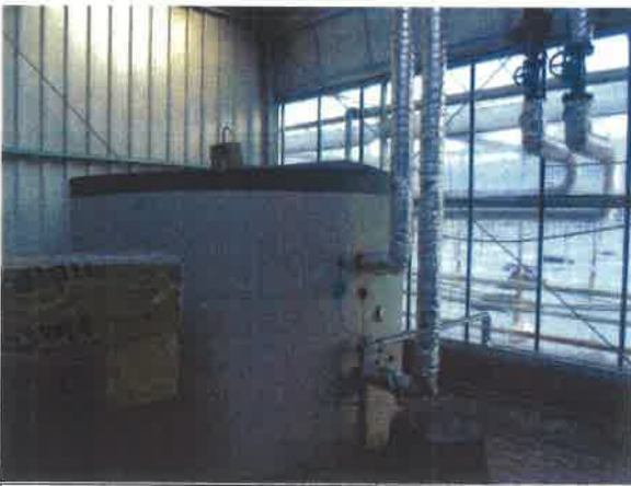
Kas met gasverwarming (SBI 0112.3)

Voorbeelden bedrijven uit genoemde bijlage: