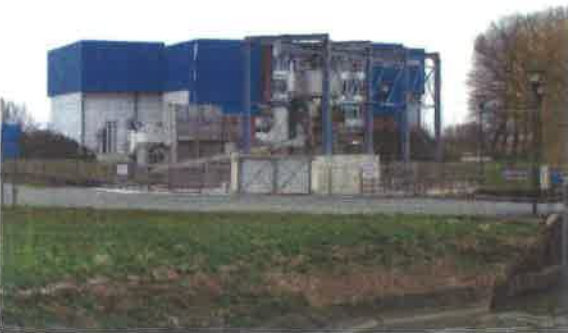
Waterdistributiebedrijf (SBI 41.B1)