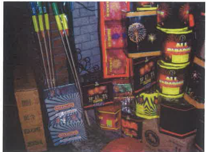
Groothandel in consumentenvuurwerk (SBI 5148.7-1)