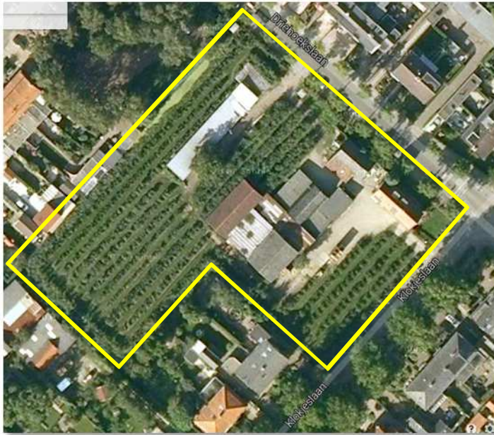
Detailopname van het onderzoeksgebied; deze wordt met de gele lijn aangeduid.