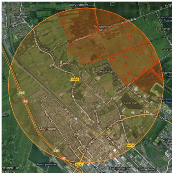
Ligging van Natura 2000-gebied in een straal van 3 kilometer rondom het plangebied.

Het plangebied ligt niet in- of in de direct naast een Natura 2000-gebied of Beschermd Natuurmonument. Op circa een kilometer ten noordoosten ervan ligt het Natura 2000-gebied 'Oostelijke Vechtplassen' (Min. EZ 2014).