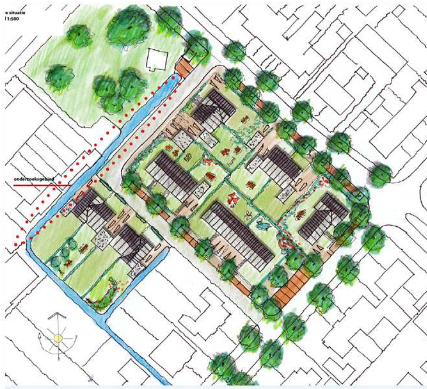
Weergave van de beoogde situatie binnen het plangebied

De voorgenomen activiteit bestaat uit het herontwikkelen van het plangebied. Hiertoe wordt de bestaande bebouwing gesloopt, de boomgaard geroid en nieuwbouw gepleegd. In totaal worden veertien nieuwe woningen gebouwd. Op onderstaande afbeelding wordt de beoogde situatie weergegeven.