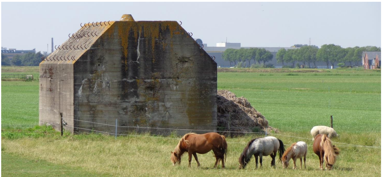
Referentiebeeld van een groepsschuilplaats type P (hier in de buurt van Vuren)