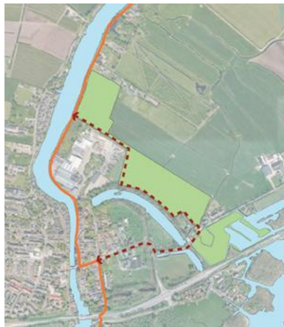
Uitsnede uit de Ambitiekaart Nieuwe Hollandse Waterlinie (links) en Uitsnede uit visiekaart uit Nota Landschappelijke en uitgangspunten Vreeland (rechts)