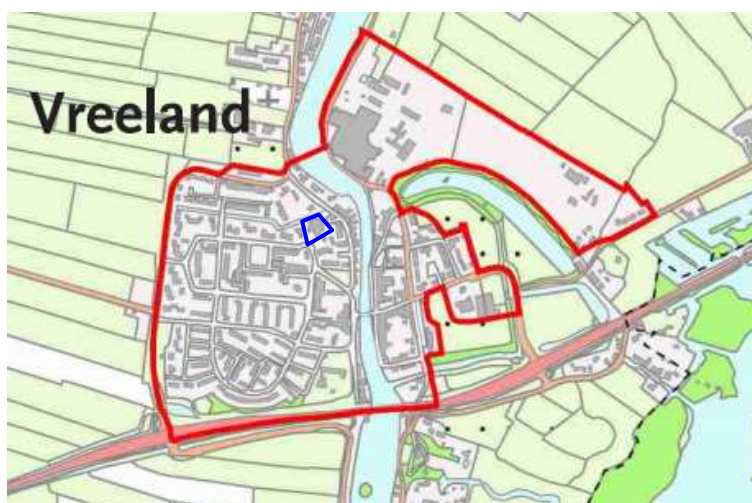
Rode contour Vinkeveen met in blauw ligging van het plangebied (Provinciale Ruimtelijke Verordening)

In de PRS is per regio en per gemeente een programma voor wonen opgenomen. Daarbij is een onderscheid gemaakt naar inbreiding (binnen de rode contour) en uitbreiding (buiten de rode contour). Aan het concretiseren van de uitbreidingslocaties worden in de stedelijke programma's voorwaarden gesteld. Het plangebied ligt binnen de rode contour van Vreeland. Voor ontwikkelingen binnen de rode contour zijn geen voorwaarden gesteld.