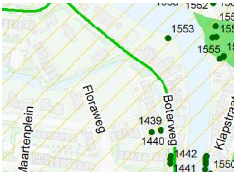
Uitsnede Groene Kaart

Door de gemeente is onlangs de Groene Kaart Stichtse Vecht opgesteld. Hierin zijn onder meer de historische groenelementen, monumentale bomen en groenstructuren en groenzones opgenomen.