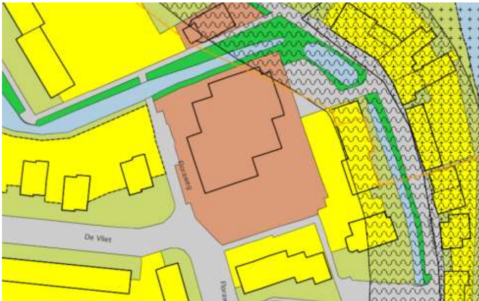
Uitsnede bestemmingsplan 'Vreeland'