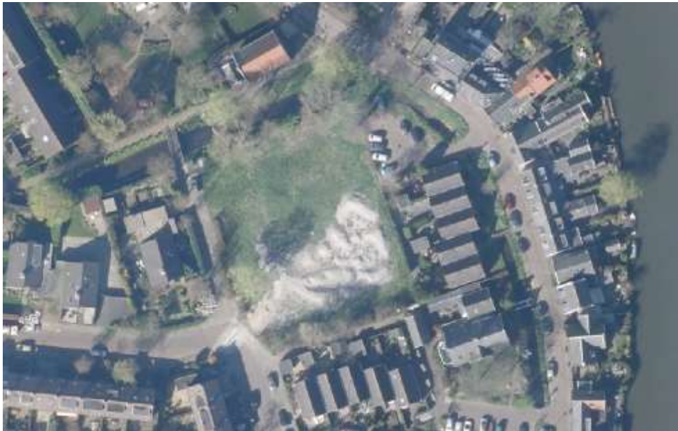
Bestaande situatie plangebied (Globespotter 2014)

Het plangebied ligt tussen de Floraweg en de Boterweg aan de noordzijde van het dorp Vreeland. De planlocatie maakt deel uit van een uitbreidingswijk van Vreeland. Het terrein is momenteel braakliggend. In het verleden bevond zich ter plaatse de Christelijke Basisschool Vreeland (CSV). Deze is sinds 2009 vertrokken naar een nieuwe locatie. Het plangebied wordt aan de oost-, zuid- en westzijde begrensd door woningbouw. Aan de noordzijde bevindt zich een waterloop. Ten noorden hiervan bevindt zich aan het Molenpad een voormalige gereformeerde kerk. Deze kerk staat momenteel te koop om te worden herbestemd als kantoor- of bedrijfslocatie. In het noordwestelijk deel van het plangebied is een rioolgemaal aanwezig.