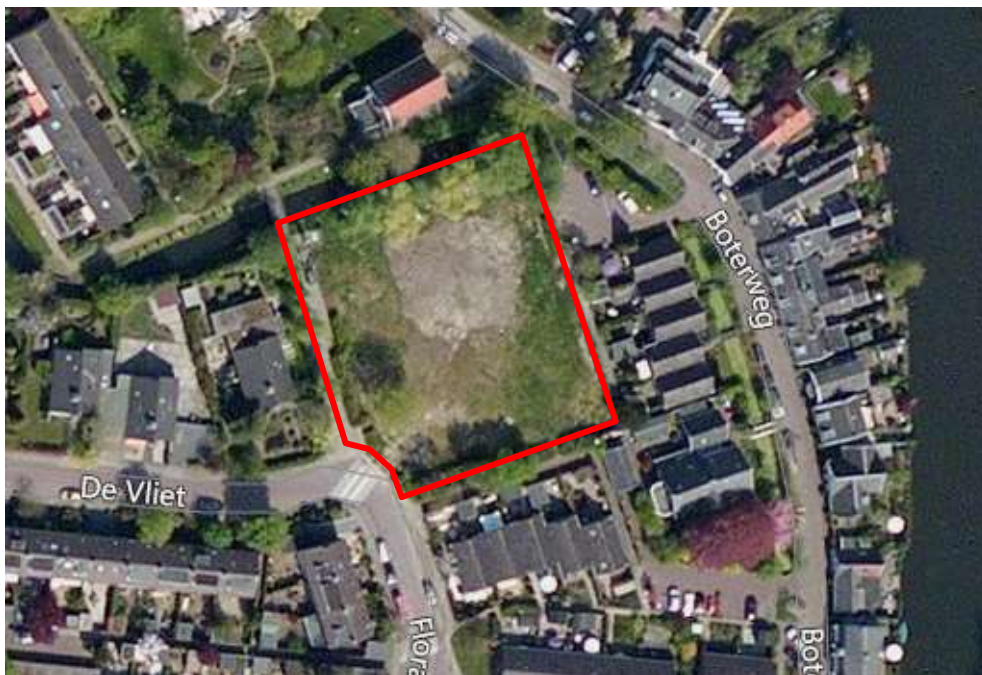
Ligging en globale begrenzing plangebied (Bing Maps 2015)