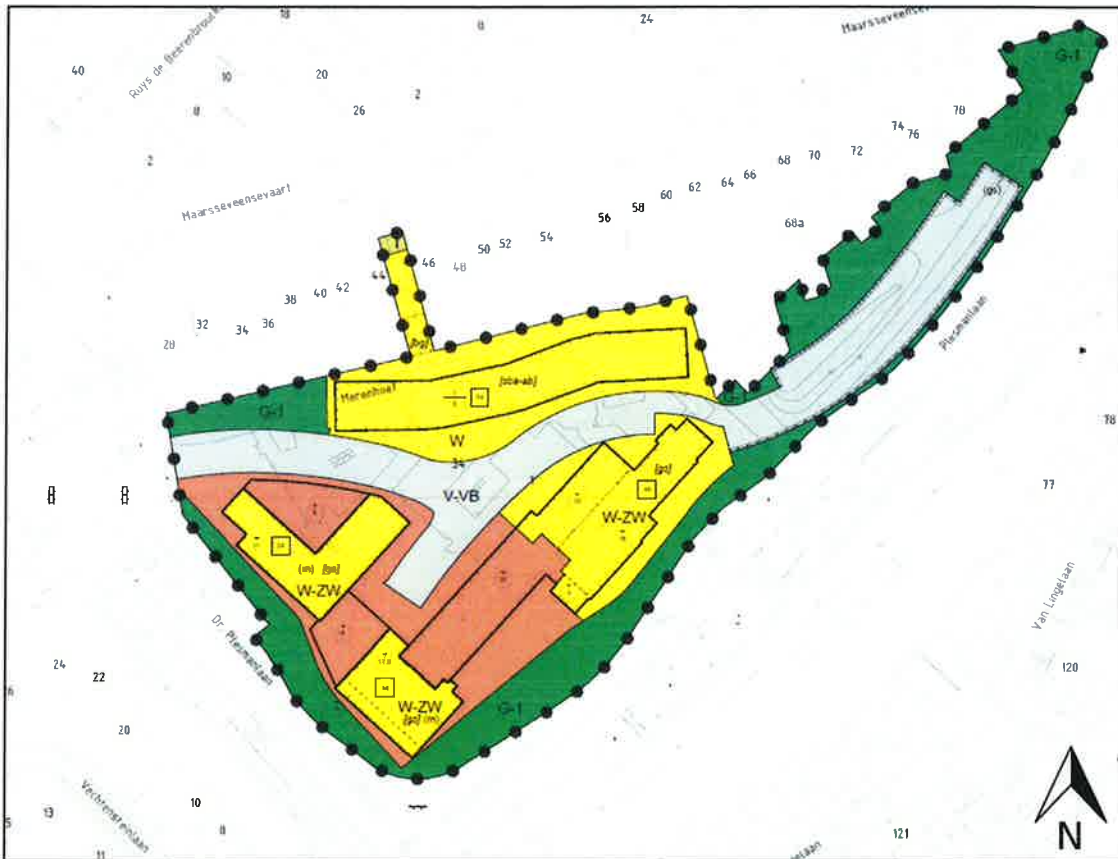
Figuur 1: Uitsnede plankaart