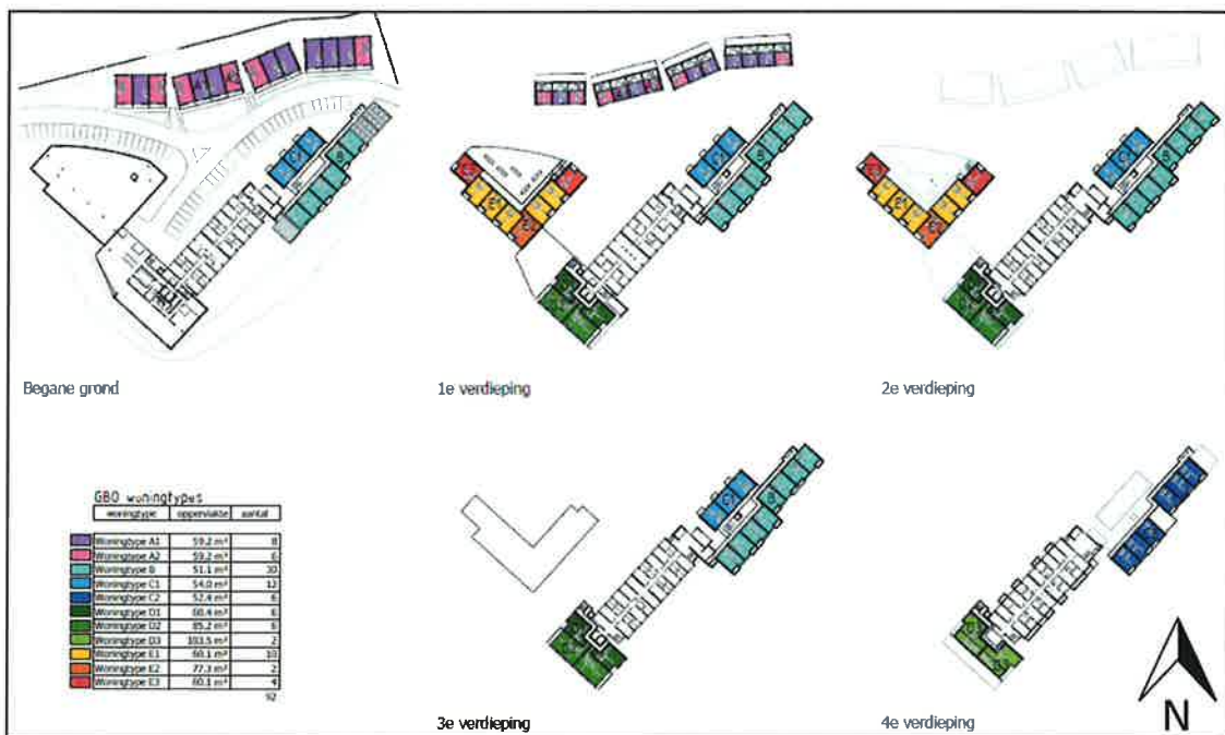
Figuur 2: Voorlopig ontwerp