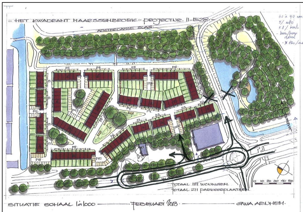
Figuur 1: principeschets

De lange botrotone komt op de Floraweg tussen de Boomstede en de uitrit van het tankstation (zie figuur 1)