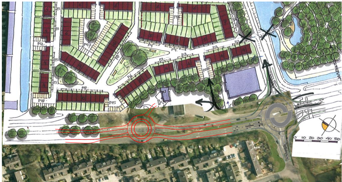
Figuur 3: indicatieve weergave rotonde in plantekening