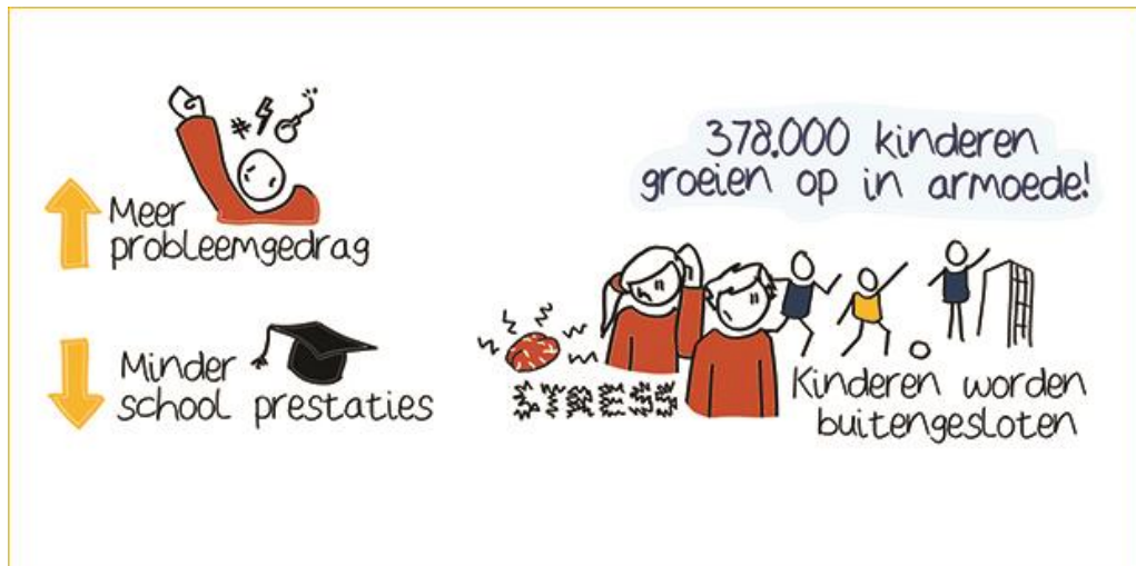
Minderjarige kinderen uitgesloten door financiële beperkingen, 2014