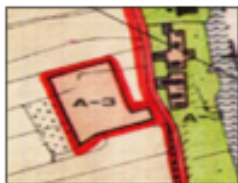
1978, Bp Buitengebied