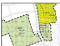
2019, 2e Rp Landelijk Gebied Noord