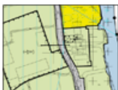
2015, Bp Landelijk Gebied Noord

April 2014, OV Verleend, Nigtevechtseweg 190