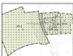
2012, Bp Nigtevechtseweg 188 - 190