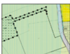
2018, 1e Rp Landelijk Gebied Noord