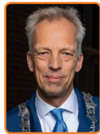
Vijfheerenlanden, S. Frölich