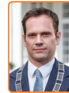
De Bilt, S. Potters