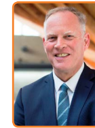
Gooise Meren, H. ter Heegde