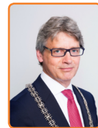
Amersfoort, L. Bolsius