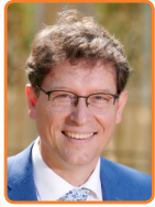
Noordoostpolder, R. de Groot