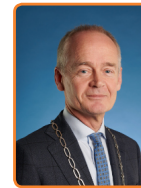
Huizen, N. Meijer