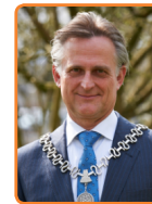
Soest, R. Metz