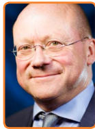
De Ronde Venen, M. Divendal