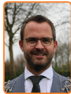
Lopik, L. de Graaf