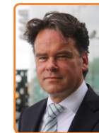
Openbaar Ministerie, R. Jeuken