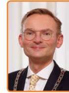
Laren, N. Mol