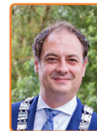
Leusden, G. Bouwmeester