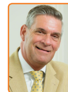
Utrechtse Heuvelrug, G. Naafs