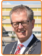
Zeewolde, G.J. Gorter