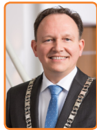
Stichtse Vecht, A. Reinders