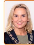
Wijdmeren, C. Larson