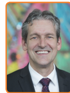
Rhenen, J. van der Pas