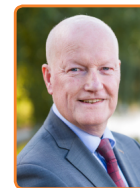
Bunnik, R. van Bennekom