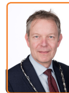
Baarn, M. Röell