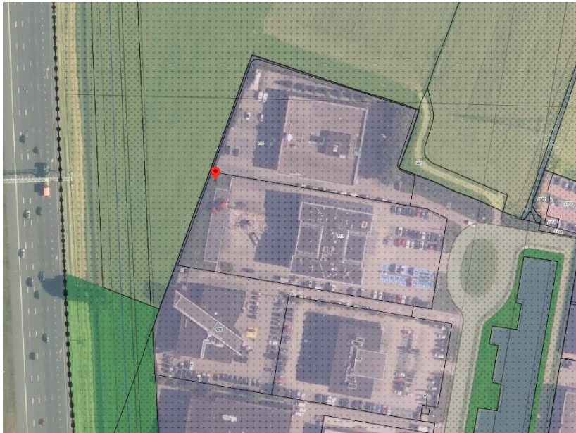
Figuur 2. Locatie van de te

De locatie is nabij de rode marker. Zie figuur 2 locatie van de te plaatsen reclameobject.