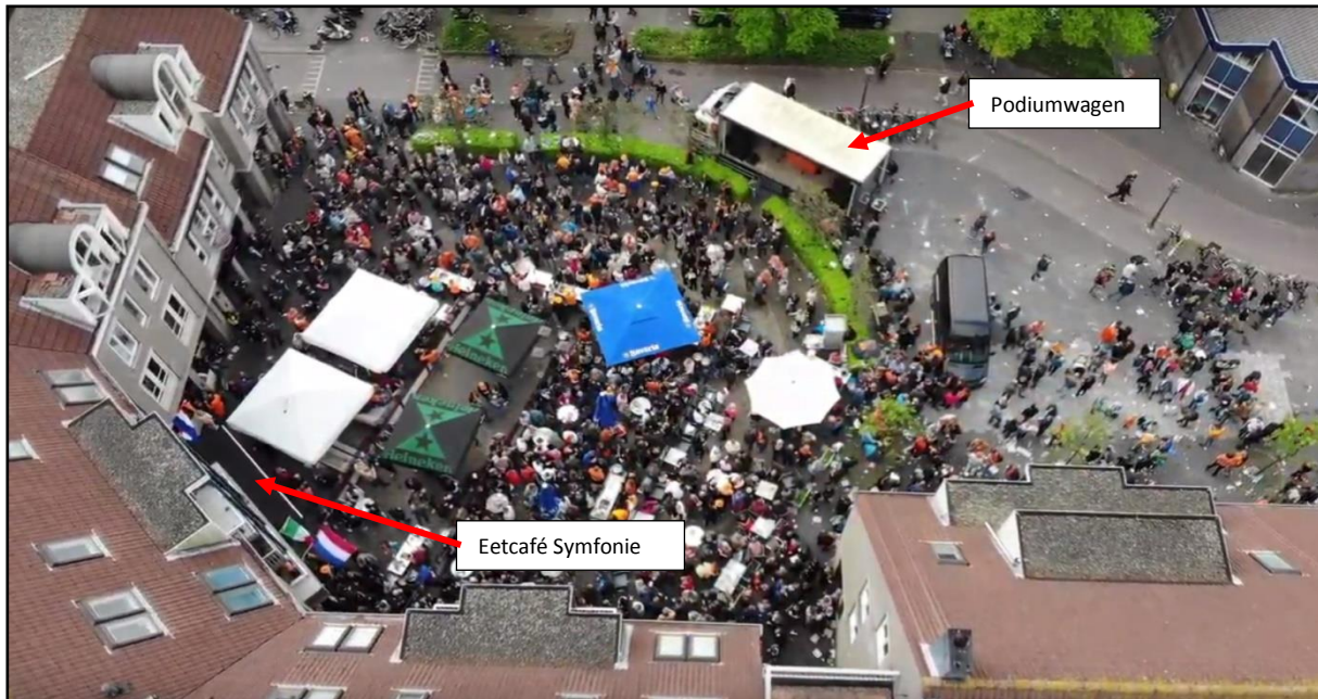
Luchtfoto Koningsdag met podiumwagen tegenover eetcafé Symfonie.