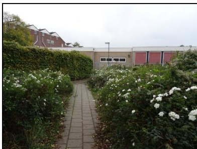
Figuur 3. Vanuit de haag (links in beeld) werd tijdens het veldbezoek huismus gehoord. De vegetatie op de foto biedt beschutting bij foerageren.