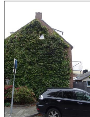
Figuur 11. De begroeide gevel bij het woningblok dat niet zal verdwijnen bij de herinrichting.