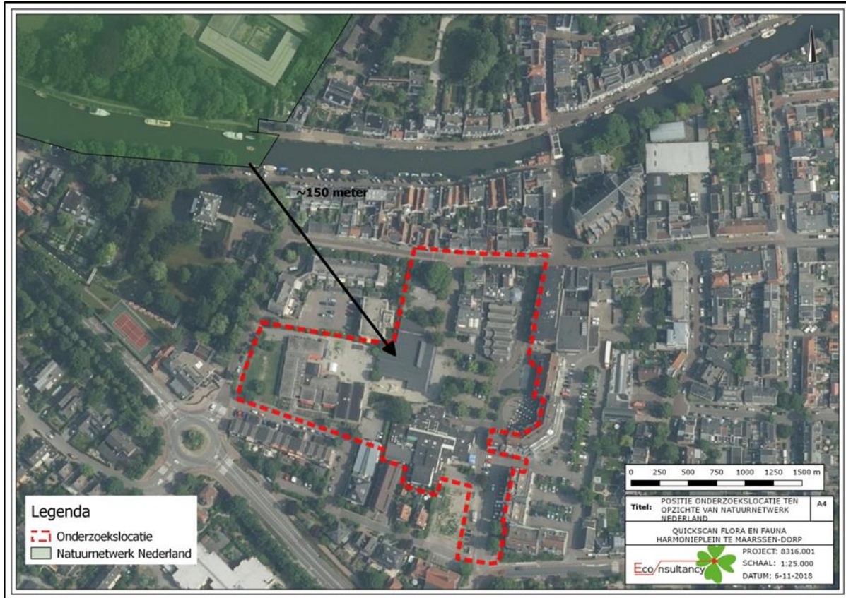
Figuur 14. Ligging onderzoekslocatie ten opzichte van het Natuurnetwerk Nederland.

gebied bevindt zich circa 150 meter ten zuiden van de onderzoekslocatie. Het betreft Park Doornburgh. In figuur 14 is de ligging van de onderzoekslocatie ten opzichte van het Natuurnetwerk Nederland weergegeven.