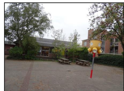
Figuur 8. Noordaanzicht basisschool Het Kompas. De vegetatie biedt mogelijk nestgelegenheid voor vogels als heggenmus en merel.