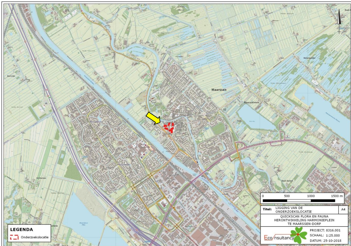
Figuur 1. Topografische ligging van de onderzoekslocatie.

De onderzoekslocatie ( \pm 18.000 \text{ m}^2 ) ligt aan de Harmonieplein, circa 300 meter ten zuiden van de kern van Maarssen, en betreft diverse gebouwen. In figuur 1 is de topografische ligging van de onderzoekslocatie weergegeven. Volgens de topografische kaart van Nederland, kaartblad 31H (schaal 1:25.000), zijn de coördinaten van het midden van de onderzoekslocatie X = 131.130 , Y = 461.276