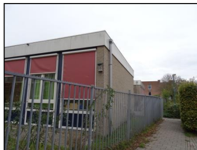
Figuur 4. Één van de nestkasten aan basisschool Bolenstein, Vanuit de haag (rechts in beeld) is een roepende huismus waargenomen.