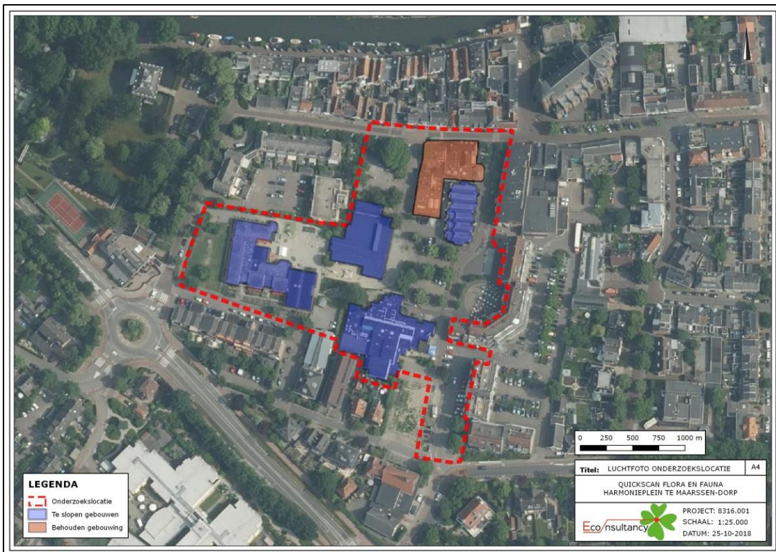
Figuur 2. Luchtfoto onderzoekslocatie en directe omgeving. Gebouwen waarvan de intentie is te slopen zijn aangegeven met blauwe vlakken. Het rode vlak geeft het woningblok aan dat ontzien wordt van herinrichting.