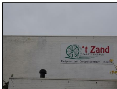
Figuur 7. Open stootvoegen in het hoge deel van partycentrum 't Zand Beide bieden toegang tot mogelijke verblijfplaatsen van vleurmuizen.