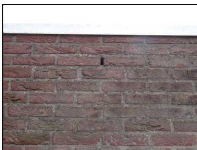
Figuur 6. Open stootvoegen zijn eveneens aanwezig bij basisschool Bolenstein.