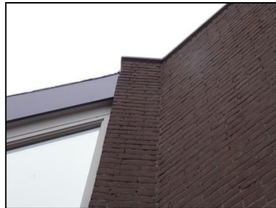
Figuur 10. Detail opname van de daklijst van de Bibliotheek. Boarding sluit goed aan waardoor er weinig tot geen toegang is voor ruimtes in het gebouw.