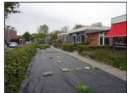
Figuur 5. De kruiden- en groentetuin van basisschool Bolenstein, deze levert een positieve bijdrage aan het leefgebied van de huismus.