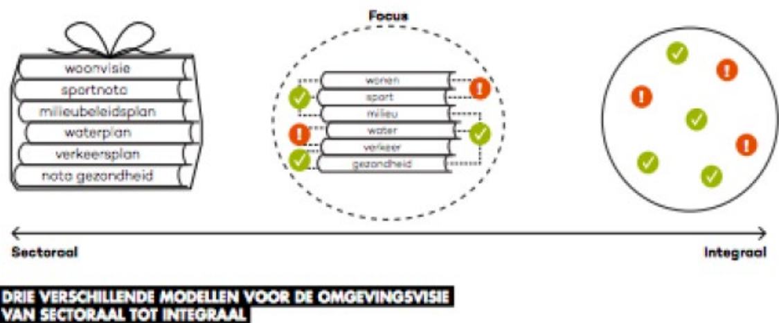
Figuur 2. Modellen omgevingsvisie

Door het bureau Hiemstra & De Vries is een Impactanalyse en ambitie Omgevingswet opgesteld (april 2018). Op basis van een analyse vanuit negen thema's zijn drie mogelijke ambitieniveaus geformuleerd met als voorstel te kiezen voor ambitieniveau Optimaliseren. Dit ambitieniveau kiest ervoor om het huidige beleid aan te passen en maatwerk te leveren waar nodig. (zie middelste variant in figuur 2.) Het ambitieniveau bepaalt zo de reikwijdte van de gewenste integraliteit van de eerste omgevingsvisie.